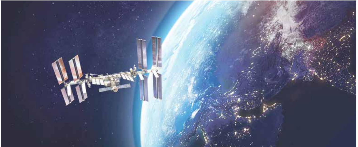
In München entsteht Europas größte Fakultät für Luft- und Raumfahrt, wodurch die Weichen Richtung Zukunft gestellt werden.

zu Herzen nehmen. Leider macht die Ampel stattdessen immer wieder schwerwiegende Fehler und setzt auf Ideologie statt auf Vernunft. Deutschland fällt zurück, während andere Länder zulegen. Ein alter Grundsatz gilt immer noch: Wirtschaft ist nicht alles, aber ohne Wirtschaft ist alles nichts.