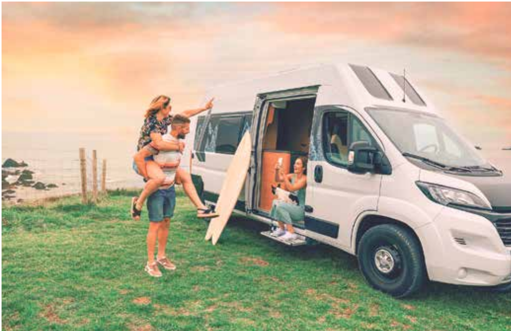
Fast jedes Auto lässt sich zum Minicamper umbauen, sagt Kursleiterin Lisa Vandea.

Workshop unterstützt bei der Planung für die Umgestaltung