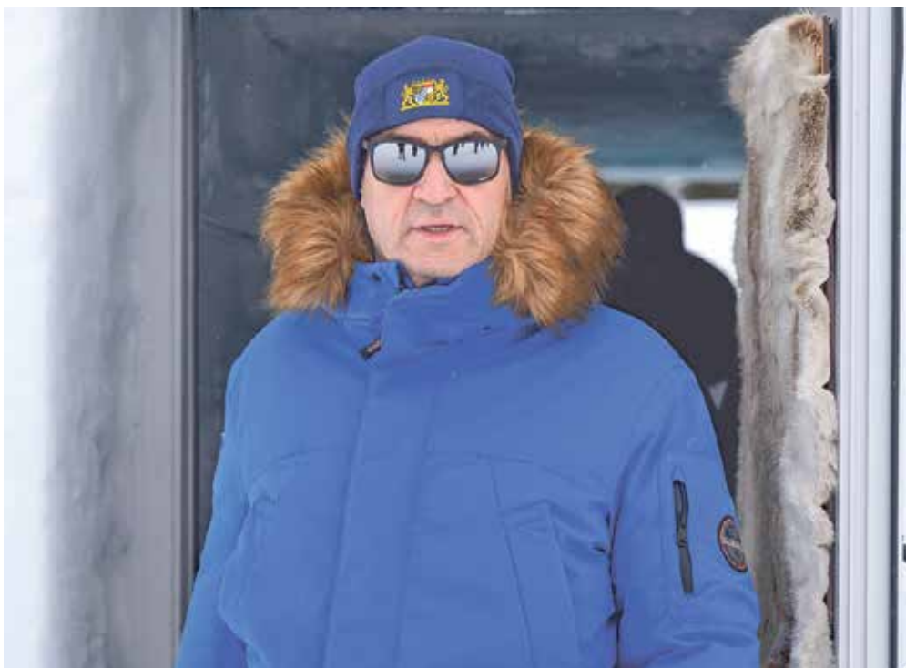
Der Ministerpräsident reiste kürzlich nach Schweden zum Esrange Space Center.

Die Hightech Agenda ist unser Bekenntnis für ein erfolgreiches Bayern auch in der Zukunft. So etwas bräuchte es für ganz Deutschland. Es braucht ein „Und“ und kein „Oder“. In den letzten Jahrzehnten gab es enorme Entwicklungen, bei denen wir dabei sein sollten. Seit der Jugend bin ich großer Fan von Raumfahrt und Science-Fiction – und was damals in manchen Filmen utopisch war, ist inzwischen in unserem realen Alltag angekommen. Ich bin kein Dystop, sondern Optimist. In Star Trek heißt es: „Space – the final frontier“. Stimmt das noch? Die Wissenschaft überwindet täglich neue Grenzen, und das in Warp-Geschwindigkeit. Deshalb glauben wir an wuchtige Investitionen in Forschung. Sie wirken noch dazu nachhaltiger als teure Subventionen in einzelne Chipfabriken. Zudem bräuchte es vom Bund eine Förderung des Mittelstands in der Breite mit niedrigeren Steuern, niedrigeren Energiepreisen und weniger Bürokratie. Wir in Bayern arbeiten hart dafür, dass wir unseren starken Wirtschaftsstandort und unsere Familienbetriebe erhalten – und damit Wohlstand für alle. Das müsste sich auch die Bundesregierung