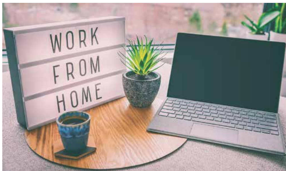
Das Arbeiten im Home-Office bringt neue Anforderungen mit sich.