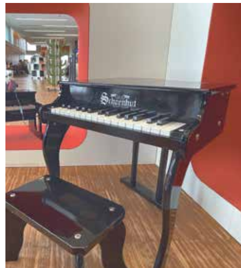
In der Musikbibliothek gibt es ein Kinderklavier...