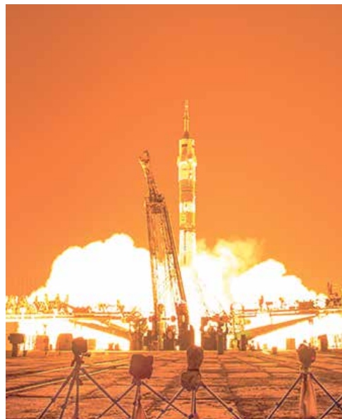
Start der Blue Dot-Mission von Alexander Gerst.

hen also für die Erde ins All. Auf der ISS kann ich Experimente machen, die ich in keinem Labor auf der Erde durchführen kann. Weil wir hier keine permanente Schwerelosigkeit erzeugen können oder andere Parameter nicht gegeben sind. Die Raumstation fliegt um die Erde mit etwa 7,8 Kilometern pro Sekunde – und das noch innerhalb des Erdmagnetfelds. Das sind Bedingungen, die kann ich auf der Erde nicht herstellen.