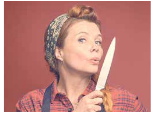
Dramatische Momente mit Augenzwinkern.

Ess- und auch sonstiges Konsumverhalten aber gründlich umgekrempelt. Die Übersetzung ist jetzt 14 Jahre her und wirkt immer noch nach.