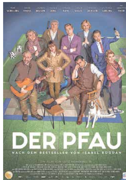
Die Verfilmung des Romans war ein „Riesenglück“ für die Autor*innen.

Ein Mitspracherecht hat man formaljuristisch eher nicht – man verkauft die Rechte, und dann kann jemand anderes mit dem Stoff machen, was er will. Ich hatte aber in beiden Fällen das Riesenglück, dass die Produktionsfirmen mich einbezogen haben und meine Meinung hören wollten. Und beide Filme sind fantastisch geworden. Es gab rauschende Premierenfeiern, für den „Pfau“ in Köln und für „Laufen“ auf dem Münchner Filmfest. Es war alles sehr glamourös und großartig!