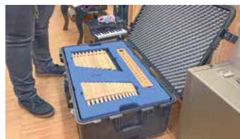
...und eine Orgel zum selber Zusammenbauen.