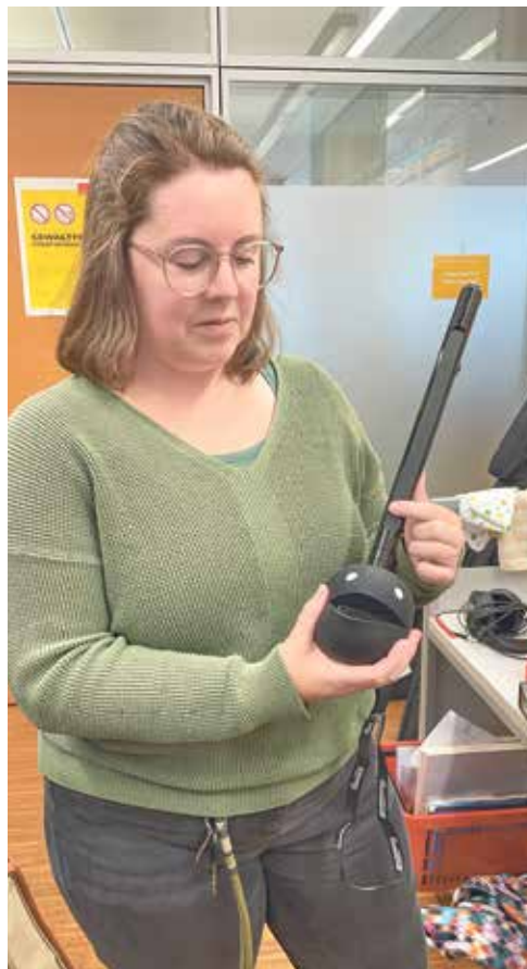
Das Otamatone stammt aus Japan.