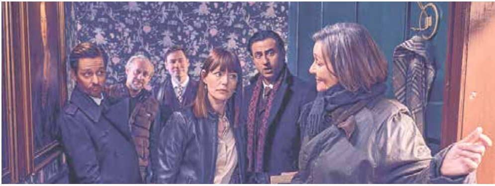
Die Schauspieltruppe erweckt die Romanfiguren zum Leben, wie hier bei „Der Pfau“.