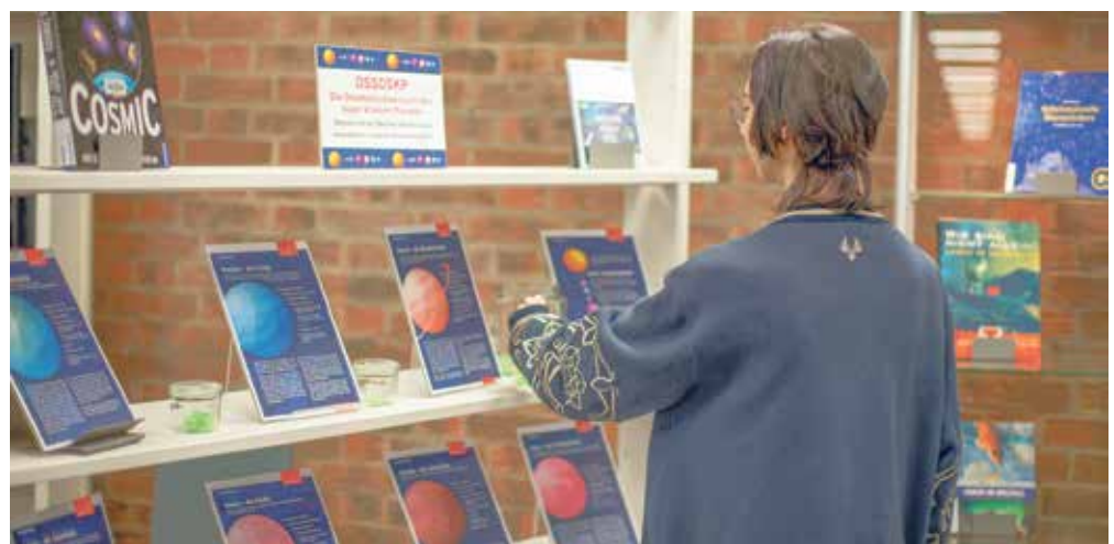
Über die Planeten informieren Schautafeln und Bücher.