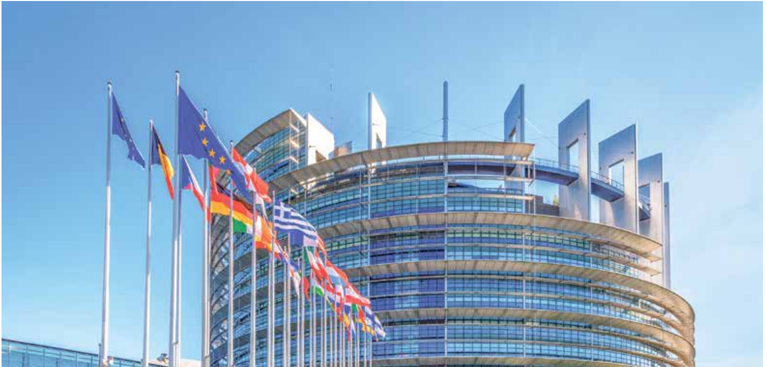
Anfang Juni wird das Europaparlament neu gewählt. Viele wissen gar nicht, wie das Parlament in Straßburg funktioniert.

nicht auf die Ukraine beschränkt, sondern dass Russland nach einem militärischen Erfolg weitere Länder angreifen könnte.